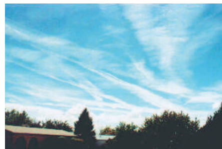
Un exemple de formation de nuages de haute altitude à partir de «contrails».

– Z: Elles agiraient donc comme des «fabriques à cirrus». Et on a observé des choses de ce genre?