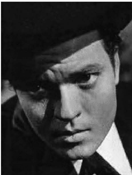
Fig. 2.: Herbert George Wells (1866-1946).