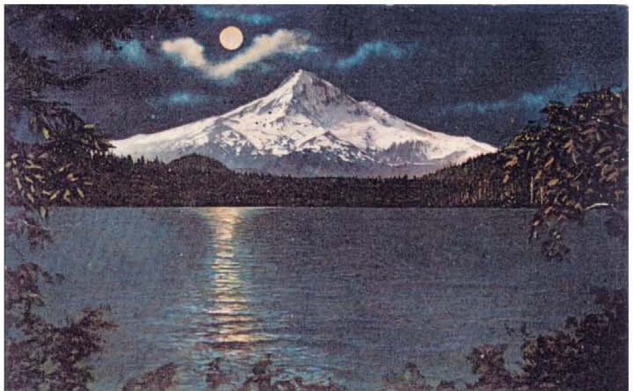
Fig. 1 – Le Mont Hood, le point culminant de l'Oregon (env. 3440m), d'après une ancienne illustration.

«Comment saurons-nous lorsque nous devons pousser?», demanda l'un des autres sages. «Certains d'entre nous vivent dans un partie du monde, d'autres ailleurs. Nous ne parlons pas tous le même langage. Comment pouvons-nous arriver à ce que chacun pousse au même moment?». Cette question mit les sages du conseil dans l'embarras, mais finalement l'un dit: «Pourquoi n'aurions-nous pas un signal? Lorsque viendra le temps de pousser, lorsque tout sera prêt, que quelqu'un crie 'Ya-hoh' et cela signifiera 'levons ensemble' dans toutes nos langues.»